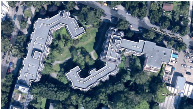
Seniorenwohnhäuser in Berlin-Schmargendorf